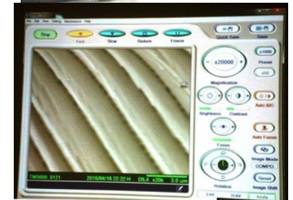
photo : nervure d'aile de papillon (grossissement \times 20\,000 )